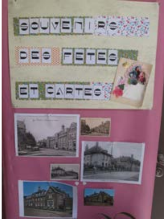
Ducasse de warneton