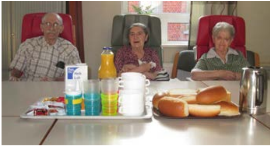
Repas à thème