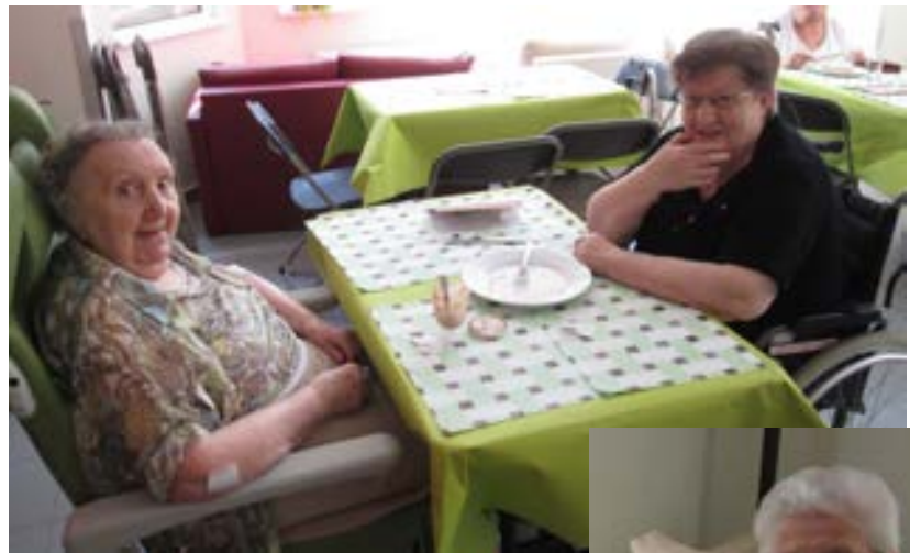
Thé dansant fête franco-belge