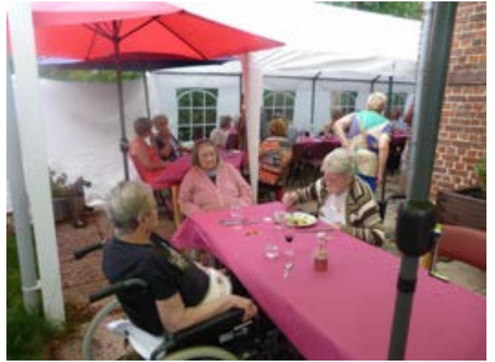
Profitions du soleil sur la terrasse....