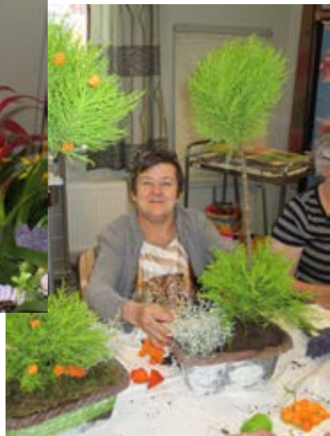
Notre sortie à La Panne....